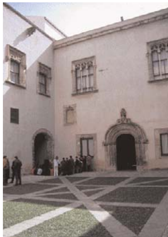
Palermo, Palazzo Abatellis, il cortile.

Ma altre questioni furono al centro dell'attenzione degli specialisti negli anni Ottanta. Le ricerche avviate sul deterioramento dei materiali, avevano evidenziato, in importanti cantieri come quello della Colonna Traiana a Roma (1980-86), la presenza di sottilissimi strati contenenti ossalati sovrapposti ai marmi originali, la cui funzione è ancora oggetto di un articolato dibattito scientifico e teorico. L'applicazione dei principi della termodinamica, sviluppata da Marcello Paribeni a partire dalla fine degli anni Settanta, portò all'ipotesi, non da tutti accettata, che tali patine avessero lo scopo di proteggere i materiali originali dal deterioramento progressivo e inarrestabile; la loro composizione chimica deriverebbe da pregressi interventi di manutenzione che utilizzavano preparati a base organica (caseina, colle di vario tipo, ecc.) per migliorare l'adesività al supporto. Secondo tale visione, suffragata da riscontri documentari, gran parte dell'architettura del passato doveva essere