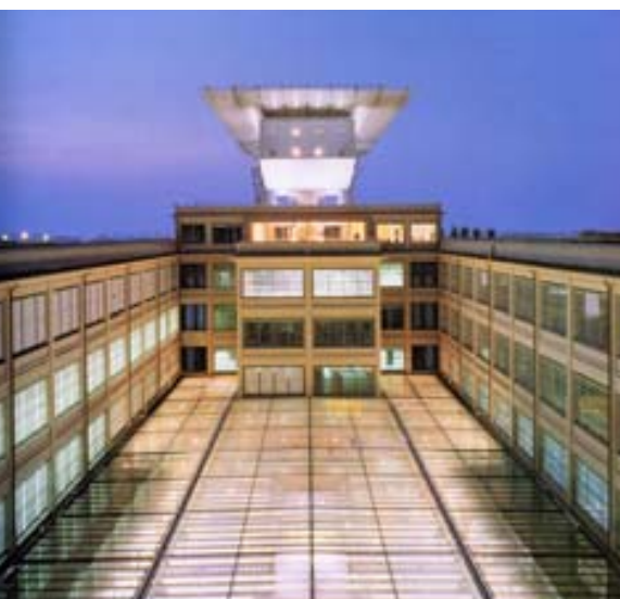
Restauro della c.d. aula Ottagona alle Terme di Diocleziano, Roma. Giacomo Mattè Trucco, Lingotto a Torino.

assunse un ruolo via via crescente l'industria chimica, naturalmente interessata al grande mercato che si andava schiudendo, la quale mise a punto una serie di formulati, o "resine", capaci di proteggere i materiali senza danneggiare la figuratività dell'opera, utilizzando preparati trasparenti, resistenti all'azione del sole e delle piogge acide e, almeno nei casi