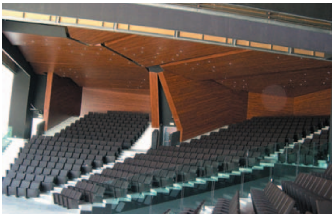
La Sala Polifunzionale.

Il corpo fuori terra è protetto da una copertura in legno (quota estradosso + 10.22 e + 8.40). Questa si compone di singole