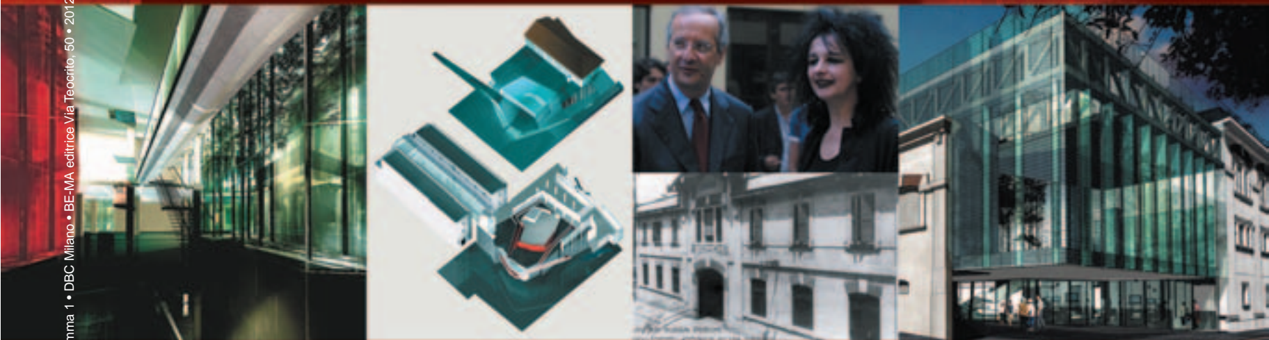
Ampliamento del Museo d'Arte Contemporanea - Roma