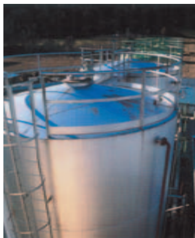
Serbatoio di stoccaggio olii.

Il bioetanolo, per la sua elevata resistenza alla detonazione, se miscelato con benzina consente di raggiungere più alti numeri di ottano e quindi di incrementare il rapporto di compressione dei motori. Tuttavia essendo il bioetanolo fortemente igroscopico per utilizzarlo con la benzina occorre adattarne le sue caratteristiche di miscelabilità. Negli USA l'approvazione da parte del Congresso Americano degli emendamenti al Clean Air Act del 1990, per imporre un contenuto minimo di ossigeno nelle benzine destinate alle aree metropolitane più inquinate, ha dato una buona spinta ai programmi di sviluppo del bioetanolo. Negli anni passati è stata commercializzata una miscela al 10% di alcol etilico, il cosiddetto gasohol, grazie però ad un cospicuo sussidio fiscale sia federale sia statale. Inoltre per una controversa questione ambientale, il mercato americano sta cercando di mettere fuori legge il MTBE (Metil Ter Butil Etere), additivo largamente adoperato per aumentare il numero di ottano della benzina, e sostituirlo con l'ETBE (Etil Ter Butil Etere), composto derivato dall'etanolo. Oggi negli USA la produzione di bioetanolo è essenzialmente da mais ed ammonta a circa 8 milioni di t/a ma sta mostrando un forte trend di sviluppo: al momento, infatti, sono in fase avanzata di costruzione 10 nuovi