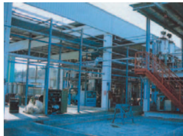
Impianto di esterificazione.

impianti della capacità di 100.000 t/a ciascuno. Cina ed India, ambedue paesi relativamente poveri di petrolio, per sostenere il loro sviluppo economico stanno lanciando programmi di impiego di bioetanolo da miscelare con la benzina, inizialmente al 5% per passare in una seconda fase al 10%. La Cina, che oggi importa oltre il 50% del suo fabbisogno energetico, per migliorare la qualità dell'aria di Pechino in occasione delle Olimpiadi del 2008 ha varato un vasto programma di produzione di bioetanolo da mais e sorgo per una capacità dell'ordine di un milione di t/a. In Europa, la Svezia ha recentemente avviato un programma di sperimentazione su circa 400 autobus della città di Stoccolma alimentati da una miscela di etanolo al 95% con additivi per migliorarne la combustione.