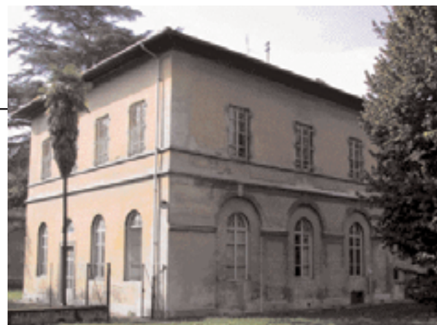
Prospetto secondario della Ex Direzione dell'Ospedale Psichiatrico.

Per innescare il processo di riqualificazione è stato escluso il ruolo di contenitore indiscriminato delle tante esigenze della città nel campo dei servizi, in quanto di proprietà pubblica, ma si è operato dosando adeguatamente i rapporti tra le strutture urbane di servizio e quelle residenziali. La scelta di inserire la residenza a San Salvi, collocata all'interno dei padiglioni esistenti ad est del com-