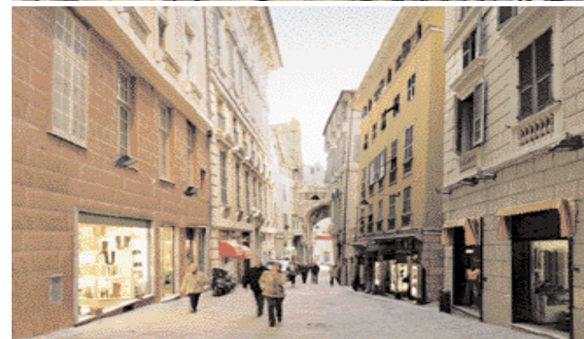
I progetti di recupero hanno riguardato singoli edifici, piazze, monumenti e intere vie.

con la supervisione e la consulenza della Soprintendenza ai Beni Architettonici e per il Paesaggio della Liguria diretta dall'architetto Maurizio Galletti. Da un primo rilievo le facciate dipinte degli edifici risultavano in avanzato stato di degrado, prime e più evidenti vittime di fenomeni atmosferici e ambientali come l'inquinamento, le piogge, l'umidità e le escursioni termiche. In particolare, il processo di degrado risultava fortemente accelerato dall'inquinamento e dagli effetti di anidride carbonica e di anidride solforosa, che unite nell'atmosfera all'acqua producono soluzioni aci-