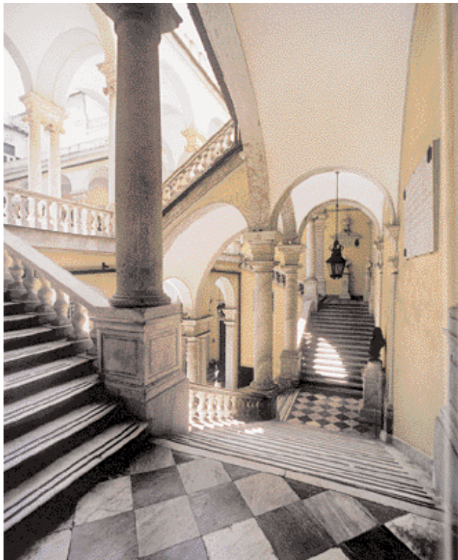
Edifici storici e nobiliari sono stati disvelati grazie ai recenti interventi di restauro e conservazione.

de letali per il materiale edile e lapideo. In una prima fase diagnostica sono state prelevate campionature di intonaco da ogni edificio e, successivamente, sono state analizzate presso laboratori tecnologici per determinare la tipologia di malte esistenti e per poter identificare e realizzare, sotto stretto controllo della Sovrintendenza, le cromie e gli effetti decorativi originari. Le nuove tinteggiature sono state eseguite con polisilicati di potassio a bassa alcalinità, una nuova generazione di prodotti minerali che restituisce effetti cromatici e artistici molto simili alle antiche tinteggiature e nel contempo offre la necessaria protezione dai fattori che determinano il degrado. Per quanto invece attiene alla scelta dei colori, la tinteggiatura dei 16 edifici ha comportato differenti problematiche per la complessità delle linee architettoniche delle facciate, per l'eterogeneità delle situazioni da affrontare e, non ultimo, per le particolari condizioni di luminosità della strada. Per queste ragioni le tinte definitive sono state scelte dopo numerosi sopralluoghi in cantiere e successive prove in laboratorio, con ulteriori verifiche in loco per constatarne la resa e la piacevolezza degli accostamenti nelle diverse condi-