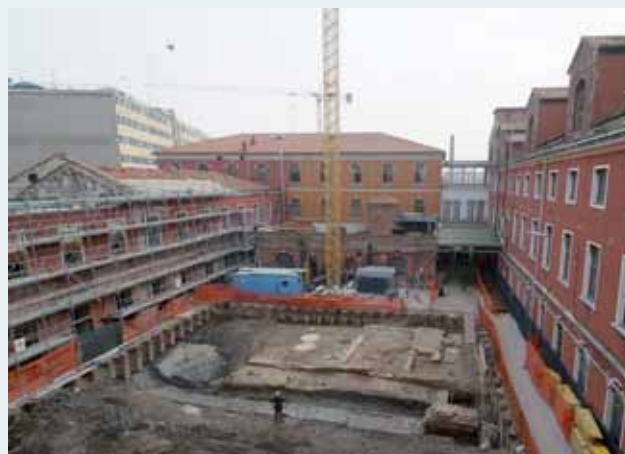
Restauro e risanamento statico del Complesso "Ex Manifattura Tabacchi" di Venezia.

Biagi: Non voglio ripetermi, ma credo che per incentivare una linea di azione, già peraltro in fase avviata, è necessario un