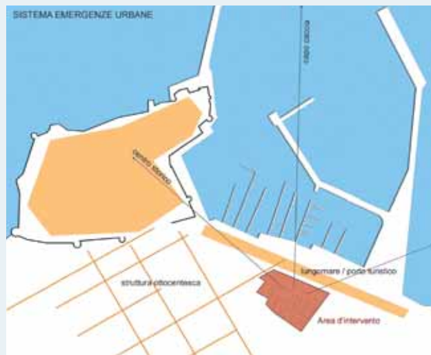
Riquilificazione dell'ex area industriale "Saica" ad Alghero.

Pompili: Evidentemente no! Gran parte del patrimonio pubblico è tra l'altro in localizzazioni strategiche. Ogni politica di dismissione dovrebbe confrontarsi prima con le esigenze degli enti locali se davvero si vuole fornire loro qualche strumento operativo in più. La linea del far cassa è storicamente perdente anche sul piano puramente finanziario e nasconde