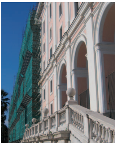
La facciata su Piazza Carlo III durante i lavori di restauro.

vinta dal raggruppamento guidato dalla Società Nomisma, ha individuato funzioni compatibili da allocare, anche per fasi, in ragione di aree indipendenti individuate intorno alle grandi corti; lo studio ha confermato i costi e gli interventi della conservazione (invarianti rispetto a qualsiasi destinazione d'uso) e ha definito in 85 milioni di euro i costi della rifunzionalizzazione (62 per l'impiantistica generale e 23 per gli allestimenti specialistici).