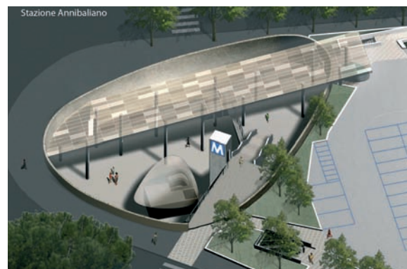
In copertina, un rendering del progetto per il tunnel autostradale di Mestre presentato nell'ambito del Concorso Internazionale "Il tunnel, il ponte e la storia" indetto dall'Anas. Articolo a pag. 36. In alto, rendering di progetto della stazione Annibaliano. Articolo a pag. 28.