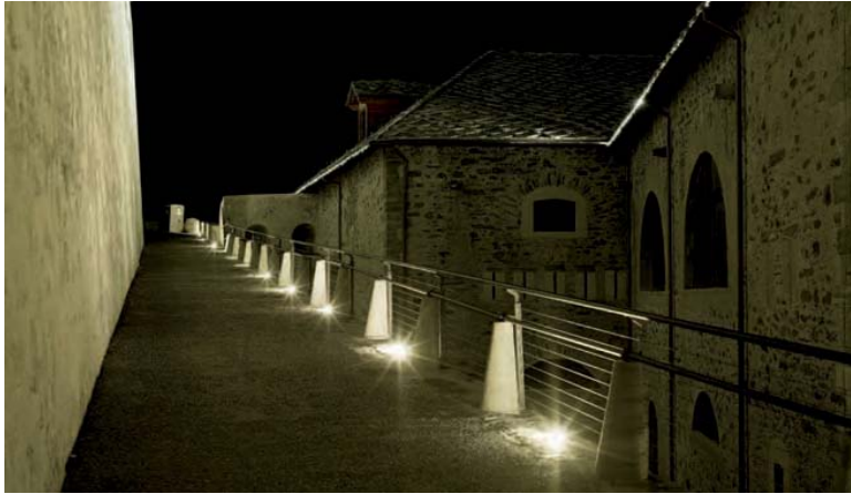
In alto e sotto, viste della strada di accesso al Forte.