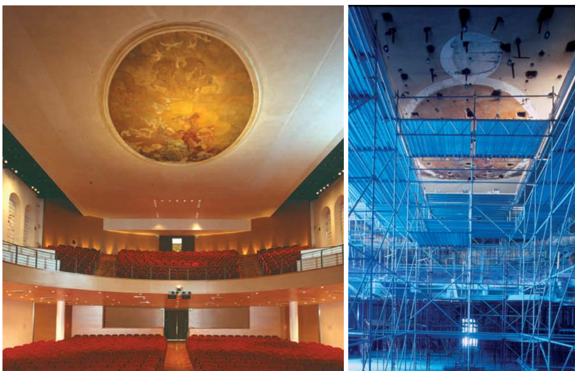
La sala interna completata e durante i lavori.

genze di una cittadina che diventava città in un inizio secolo in cui la nobiltà lasciava lo spazio all'alta borghesia commerciale e imprenditoriale. L'inaugurazione il 30 Agosto 1913 con il Rigoletto, in occasione della celebrazione del centenario della nascita di Giuseppe Verdi. Il teatro, senza una programmazione specifica, fin dall'inizio ospitò tutte le forme d'arte con la possibilità di accogliere fino a 1000 spettatori. Una crisi di programmazione tra le due guerre lo portò nel secondo dopoguerra a trasformarsi in sala da ballo e poi in cinematografo negli Anni '50, a seguito di una ristrutturazione che lo stralciò dei palchi e degli addobbi e vide la realizzazione dell'appartamento del nuovo proprietario al posto del foyer.