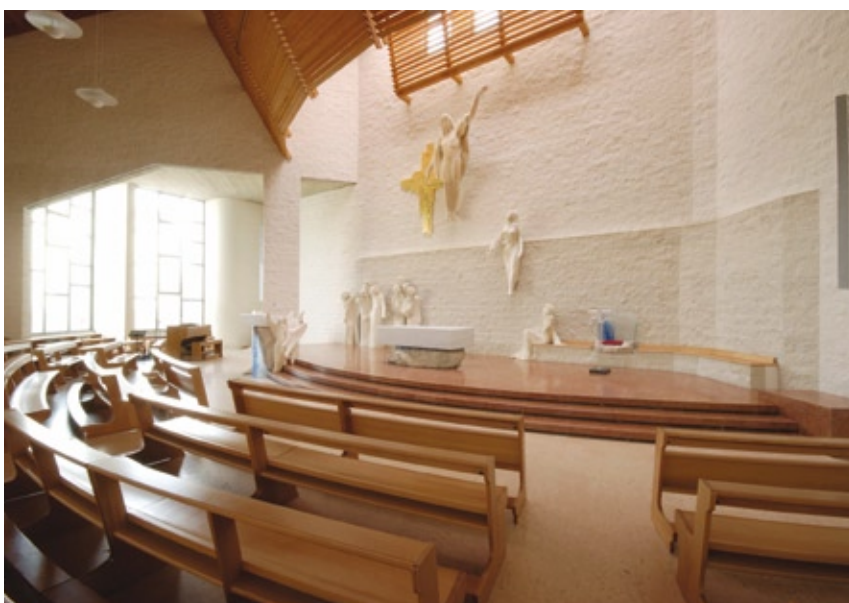
Dall'alto: la sede delle opere parrocchiali e l'aula della Chiesa.