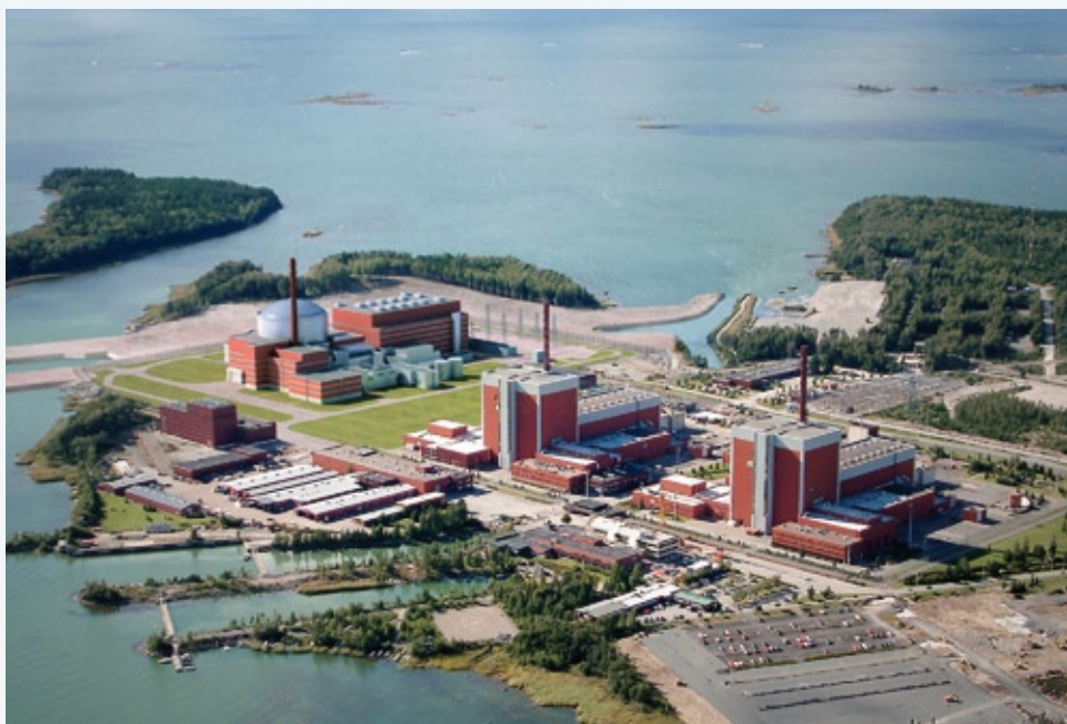
Render della centrale nucleare finlandese di Olkiluoto.

combustibile nucleare esaurito e di scorie radioattive. Quanto smantellato nelle basi navali e nei cantieri, navigherà fino ai porti dai quali il materiale verrà trasferito ai siti di trattamento e stoccaggio su treni speciali. Complessivamente l'accordo, stipulato con l'avallo da parte italiana del ministero dello Sviluppo Economico e da parte russa dall'Agenzia Federale per l'Energia Nucleare della Federazione Russa - RosAtom, prevede un impegno economico per l'Italia di 360 milioni di euro nel corso di 10 anni e contempla progetti di cooperazione anche in altri settori. La Sogin - Società Gestione Impianti Nucleari svolge il ruolo di coordinamento dell'intervento italiano.