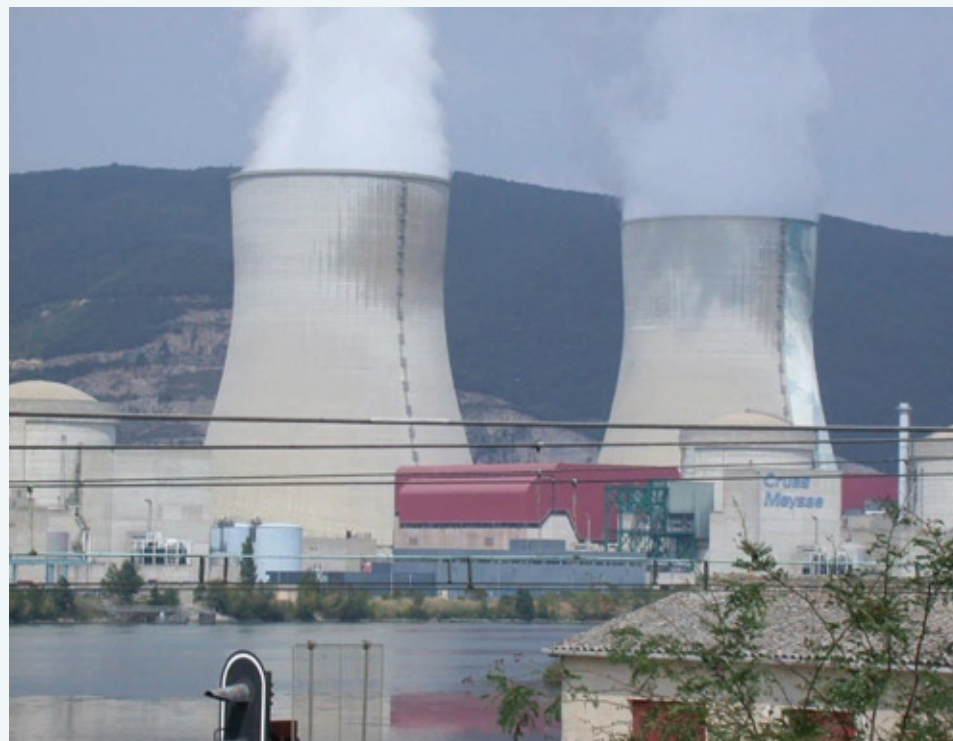
La centrale di Cruas - Meyssac in Francia.

Claudio Scajola: L'impegno di aumentare la percentuale di rinnovabili è certamente sfidante e ambizioso, ma l'Italia ha messo in campo un sistema di incentivi per le fonti rinnovabili in grado di sostenere la spinta agli investimenti del settore, che c'è ed è forte. E' bene specificare che la percentuale che abbiamo previsto come obiettivo riguarda la produzione di energia elettrica, dove esiste un notevole potenziale di miglioramento,